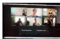
«НАВЫКИ ЭФФЕКТИВНОЙ РАБОТЫ С КЛИЕНТОМ»