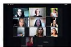
«ВВЕДЕНИЕ В НУТРИЦИОННО-ДИЕТОЛОГИЧЕСКИЙ КЛУБ»