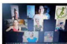
«ВАЖНОСТЬ ТА ФИТНЕС-ТРЕНИНГА»